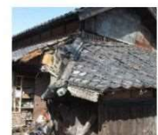
緊急代執行を要する崩落しかけた屋根