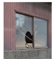
窓が割れた管理不全空家